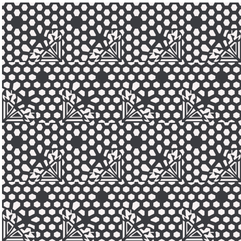
CALEPINAGE ZIG ZAG